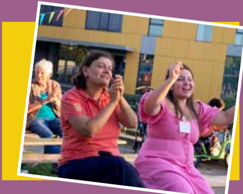
Mitarbeiterinnen des AWO Migrationsdienstes EN

Deutschsprachige Zeitung über Flucht, Liebe und das Leben mit Texten geflüchteter Frauen und Männer