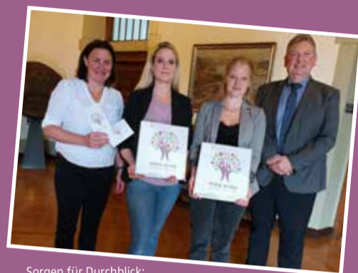
Sorgen für Durchblick: Frühe Hilfen der Stadt Wetter mit dem Elternhandbuch

Ambulanter Hospizdienst (AHD) Witten-Hattingen, www.ahd.de