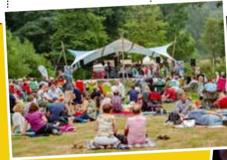
l.: Musikpicknick r.: Ennepetal MittendrIn