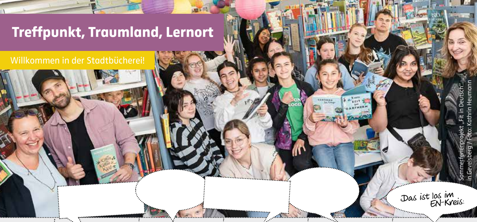
Sommerferienprojekt „Fit in Deutsch“ in Gevelsberg