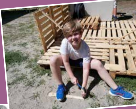
Ferienspaß am Zippe