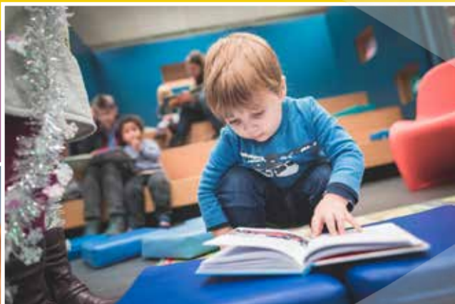
Bibliothek Witten