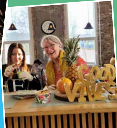
Kolleginnen der AWO EN beim FrauenKulturFest