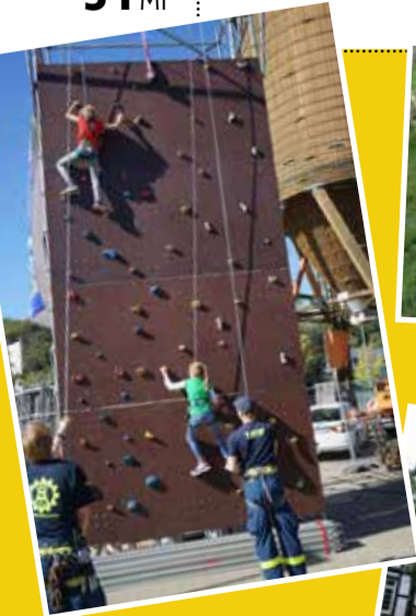
Kletterwand beim Umweltmarkt in Wetter